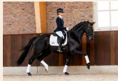
31 | Rocky H Pag. 84