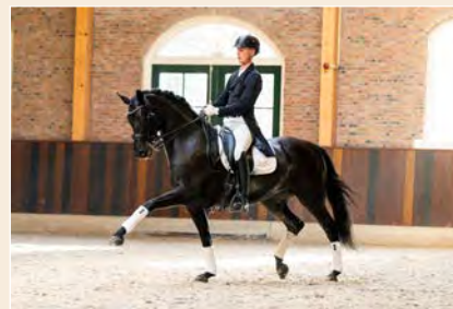
6 | Ghita Fille de Zita S Pag. 34