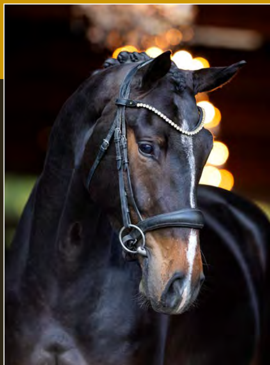
Donkerbruin • Ruin • 1.68m Darkbay • Gelding • 1.68m