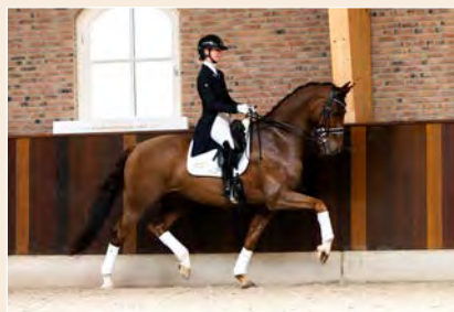
7 | Hamilton Pag. 36