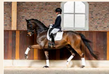
15 | Latin Dream-V Pag. 52