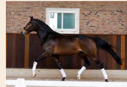
38 | Stardancer V.D. Pag. 98