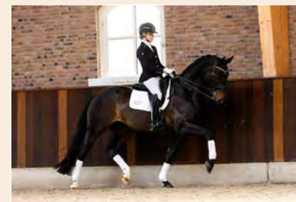
20 | Newsation STMT Pag. 62