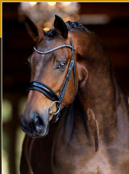
Donkerbruin • Ruin • 1.74m Darkbay • Gelding • 1.74m