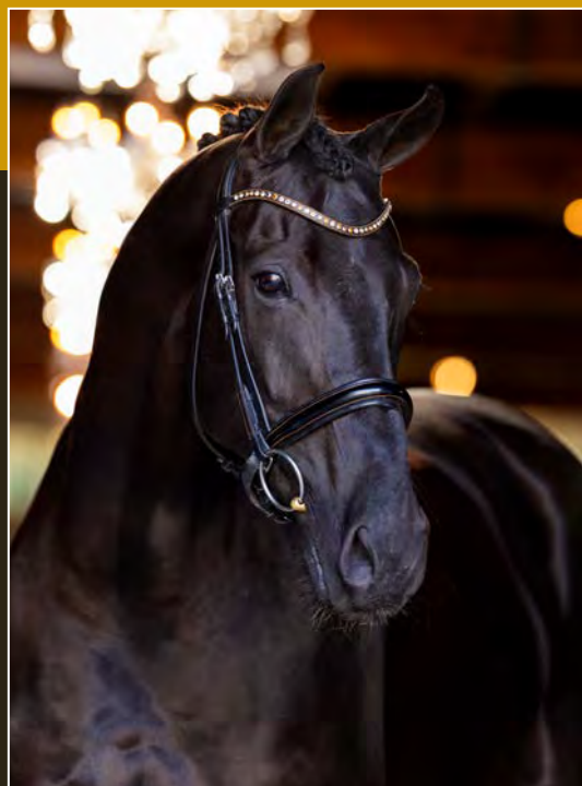
Zwart • Merrie • 1.73m Black • Mare • 1.73m