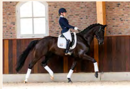
24 | Onyx Pag. 70