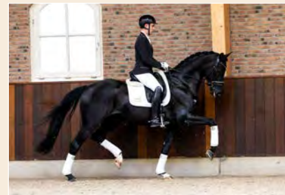
32 | Rotate Sollenburg Pag. 86