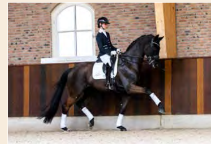
14 | Laec Pag. 50