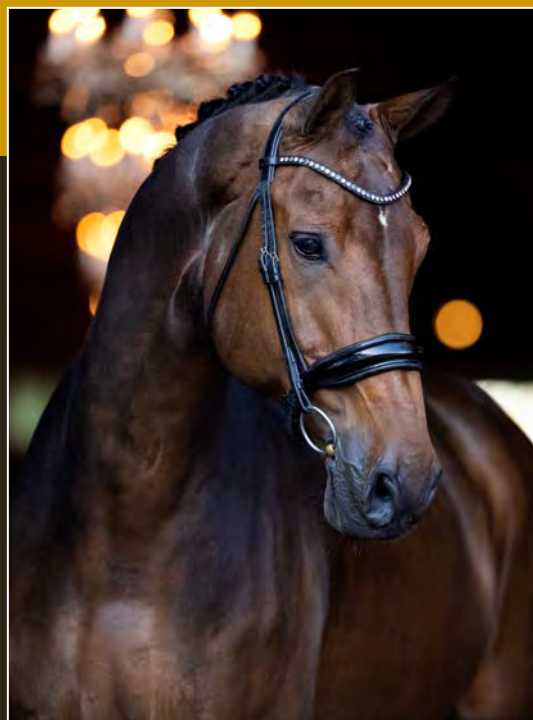
Bruin • Ruin • 1.78m Bay • Gelding • 1.78m