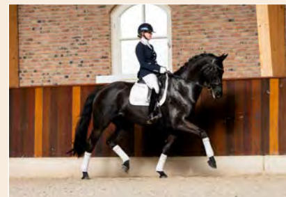
16 | Latium Pag. 54