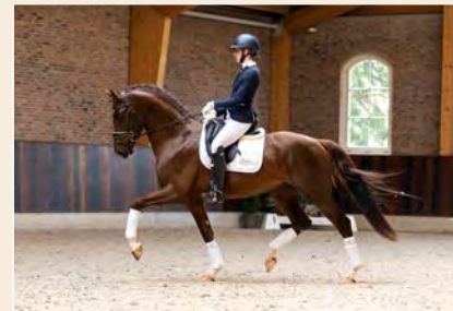
26 | Preston SB Pag. 74