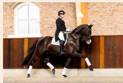
8 | Handretti Pag. 38