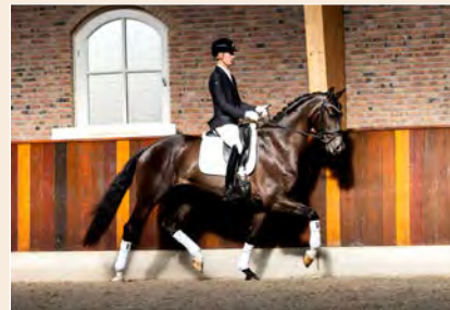
25 | Powerful B Pag. 72