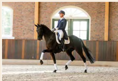
5 | Geneve Pag. 32