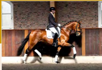
1 | DC-10 Pag. 24