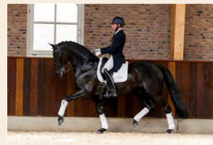
18 | Love Just Mickey Pag. 58