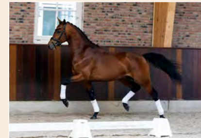
36 | Sensei VDK Pag. 94