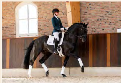
3 | Freelance Pag. 28