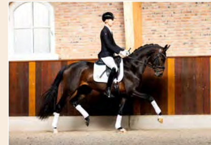
37 | Shotgun Pag. 96