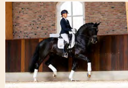
39 | Willem Normandi Pag. 100