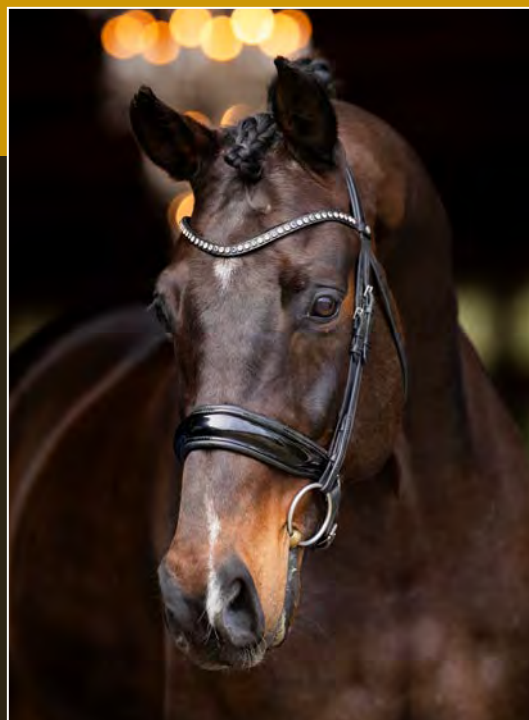
Zwartbruin • Ruin • 1.73m Darkbay • Gelding • 1.73m