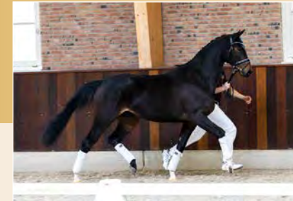
34 | Roxxi L.E. Pag. 90