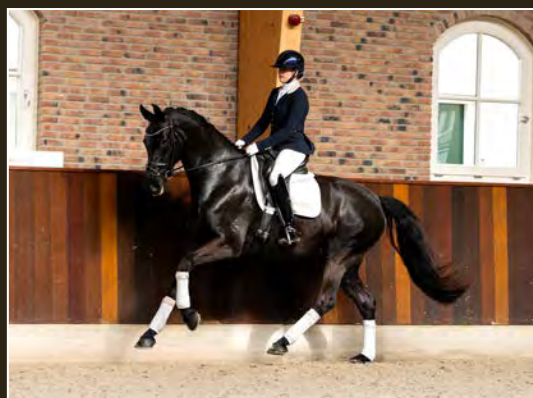
Zwart • Merrie • 1.70m Black • Mare • 1.70m

The 9-year-old mare Latium is very interestingly bred and has already performed well in sport, what more could we want. In terms of sport, she took her IBOP test as a young mare and was later brought out up to and including the ZZ-Licht class (4th level) and masters several exercises for the higher dressage sport. In terms of breeding, Latium is also very well bred and from a strong mother line. Via the sire line, the stallion Trafalgar who showed a lot of talent under saddle for piaffe and passage that he in his turn certainly inherited from the dressage phenomenon Totilas. Her mother Harimann, also competed in Z2 dressage (3rd/4th level) herself, descends from the strong dressage sire Fidertanz, father of many Grand Prix horses. Then in the pedigree we come to the Special D mare Zazoo and to the mare Tops Tanirma, at the time already a very striking mare who was classified in the Big Tour.