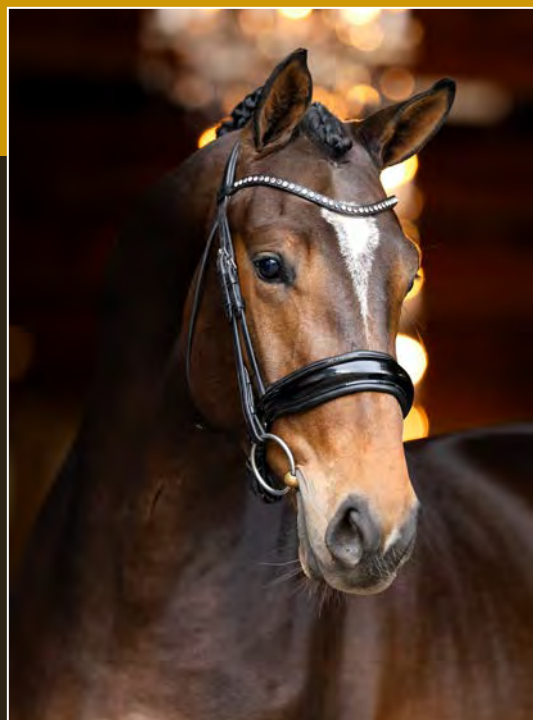
Donkerbruin • Ruin • 1.67m Darkbay • Gelding • 1.67m