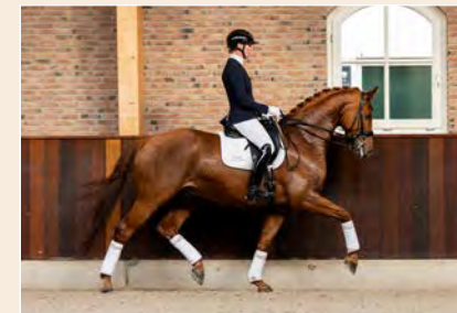
40 | Zaffar Pag. 102