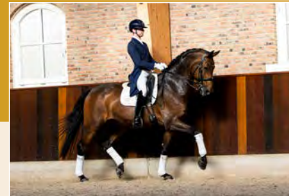
9 | Hexagon's Grandville Pag. 40