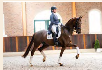
19 | Moritz P Pag. 60