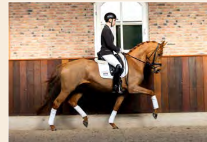
35 | Rubywood Tarpania Pag. 92