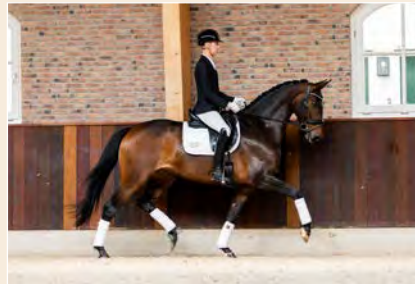
27 | Prosecco TC Pag. 76