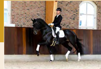
33 | Rotterdam TC Pag. 88