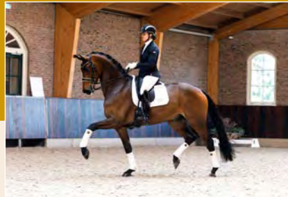
21 | Next Promise JV Pag. 64