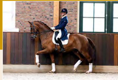
2 | De Ville FS Pag. 26