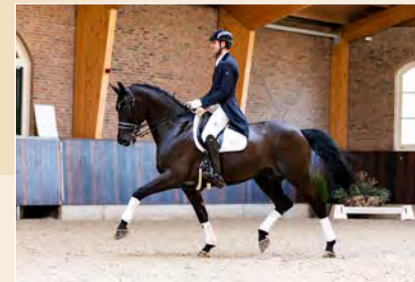
11 | In Time Pag. 44