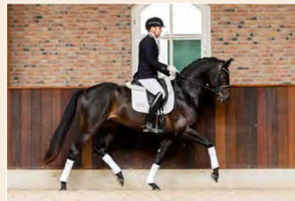
4 | Fynn Romance Pag. 30