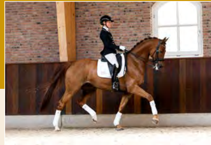
22 | Nobility T Pag. 66