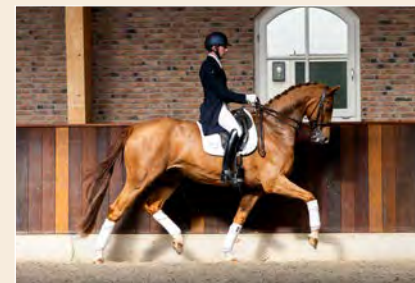
17 | Leonardo D.E. Pag. 56