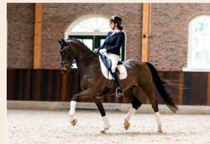
13 | King of Power SQBS Pag. 48