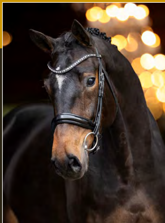
Donkerbruin • Merrie • 1.65m Darkbay • Mare • 1.65m