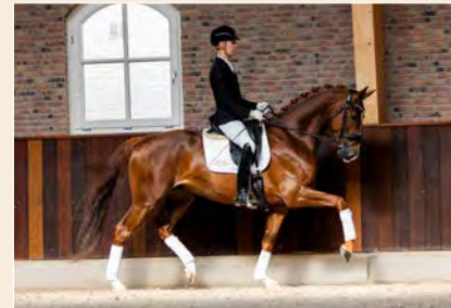
29 | Richmond TC Pag. 80