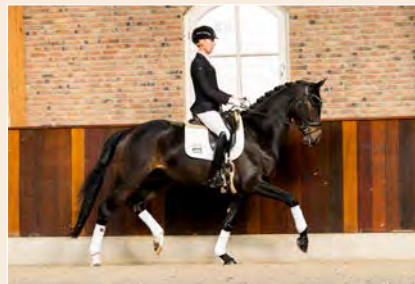
30 | Riverpool TC Pag. 82