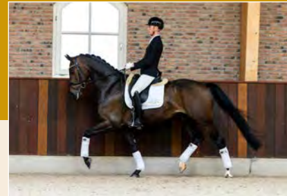
23 | Okan K Pag. 68