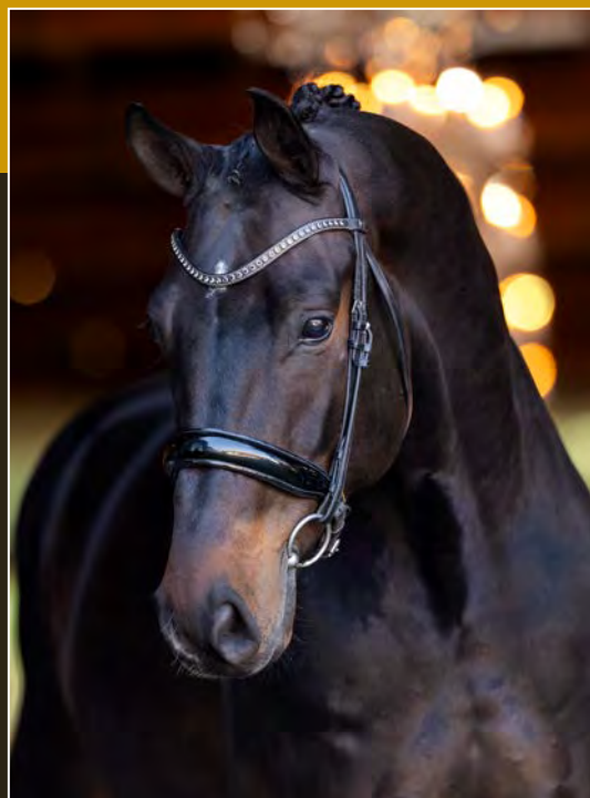
Zwartbruin • Ruin • 1.70m Darkbay • Gelding • 1.70m